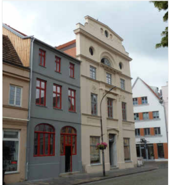
Markt 27 - 28