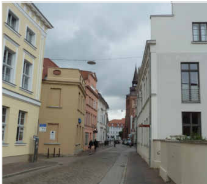
Domstraße – Ecke Kerstingstraße

Das komplette Programm und die Hinweise zu den Anmelde-möglichkeiten werden Sie in der Septem-berausgabe des Stadtanzeigers sowie auf den Internetseiten der Barlachstadt Güstrow ab 1. September 2019 finden.